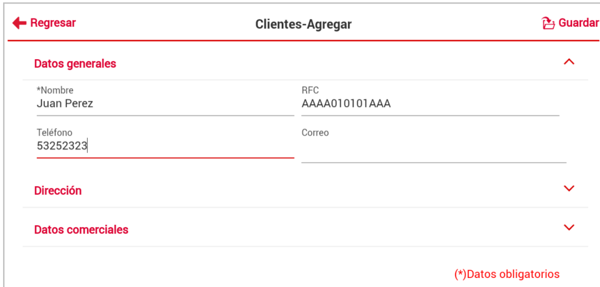
Figura 4. Ventana Alta de Cliente.

Al ingresar al detalle del cliente encontrarás su información dividida en bloques que son: Datos generales, Dirección y Datos comerciales.