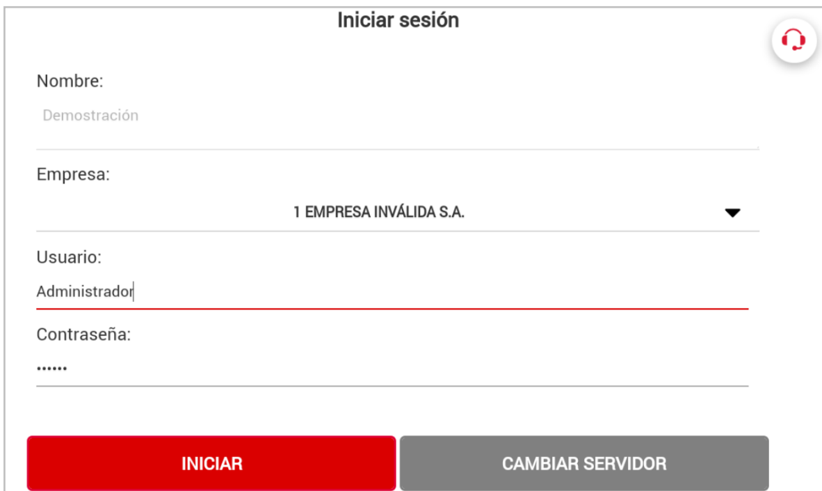
Figura 1. Ventana principal SAE Móvil.

Al ingresar mediante la Conexión Directa ó Mi nube desplegará la ventana indicando las empresas a las que se tiene acceso.