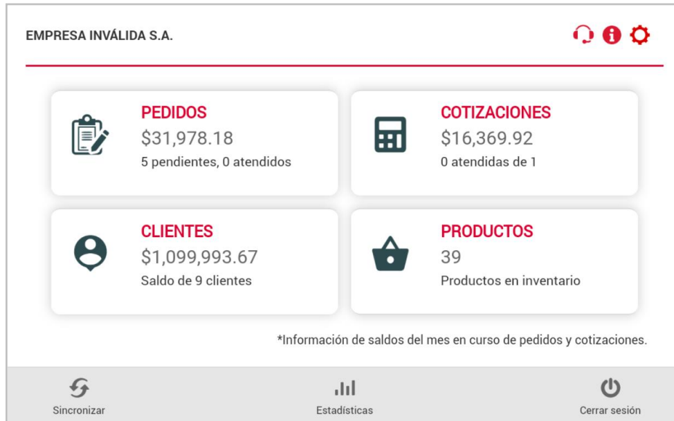
Figura 2. Módulos SAE móvil.