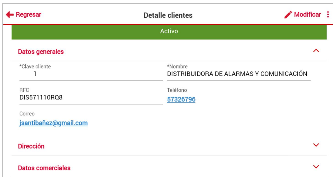
Figura 5. Ventana del Detalle del cliente.

Al ingresar al detalle del cliente encontrarás su información dividida en bloques que son: Datos generales, Dirección y Datos comerciales.