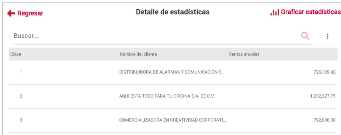
Figura 13. Detalles de estadística.

Dentro de la estadística te permite ver la información en forma de tabla o en forma de grafica.