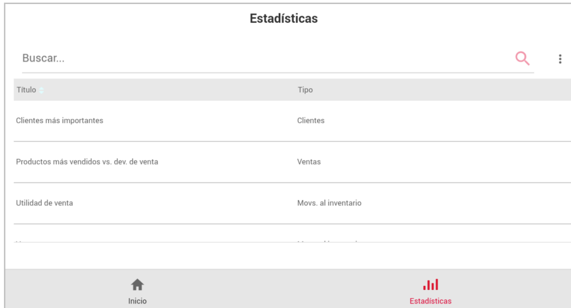
Figura 12. Consulta Estadísticas.

Podrás consultar estadísticas como los productos más vendidos, ventas del día, utilidad en la venta, entre otras para una oportuna toma de decisiones.