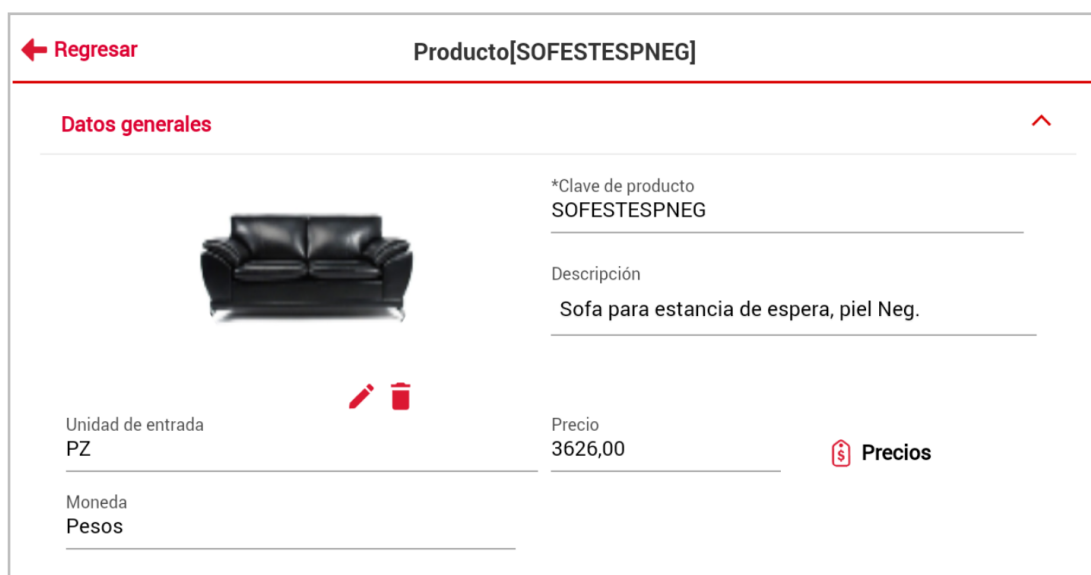
Figura 7. Ventana Detalle de inventarios.

Al ingresar al detalle del producto encontrarás su información dividida en bloques que son: Datos generales, Datos de control y Datos acumulados.